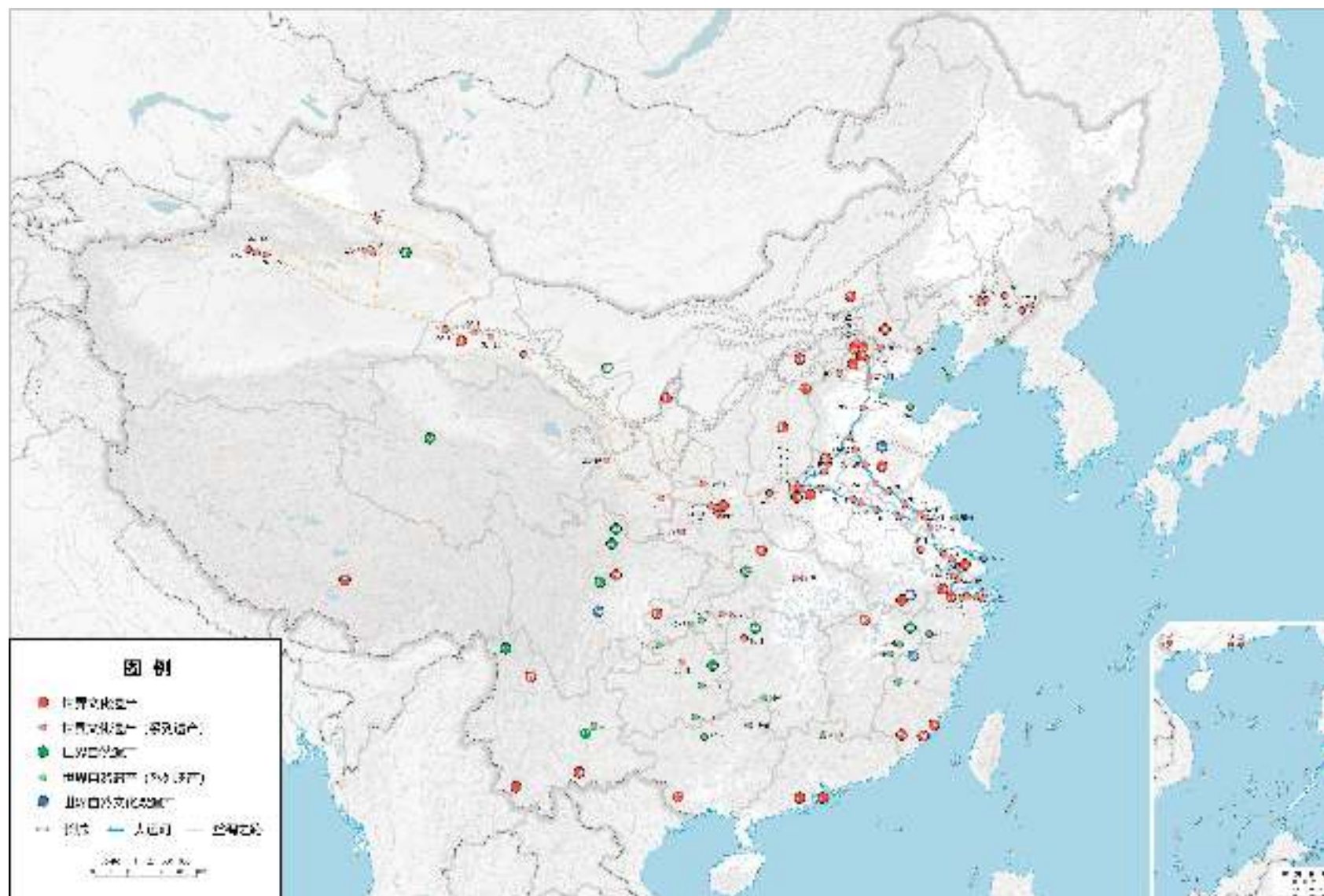
图2 中国世界遗产分布图